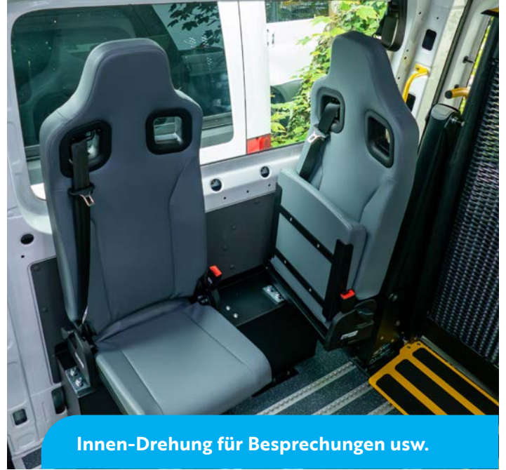
Innen-Drehung für Besprechungen usw.