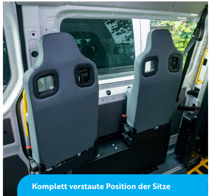
Komplett verstaute Position der Sitze