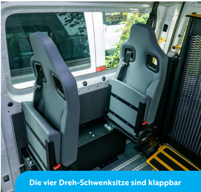
Die vier Dreh-Schwensitze sind klappbar