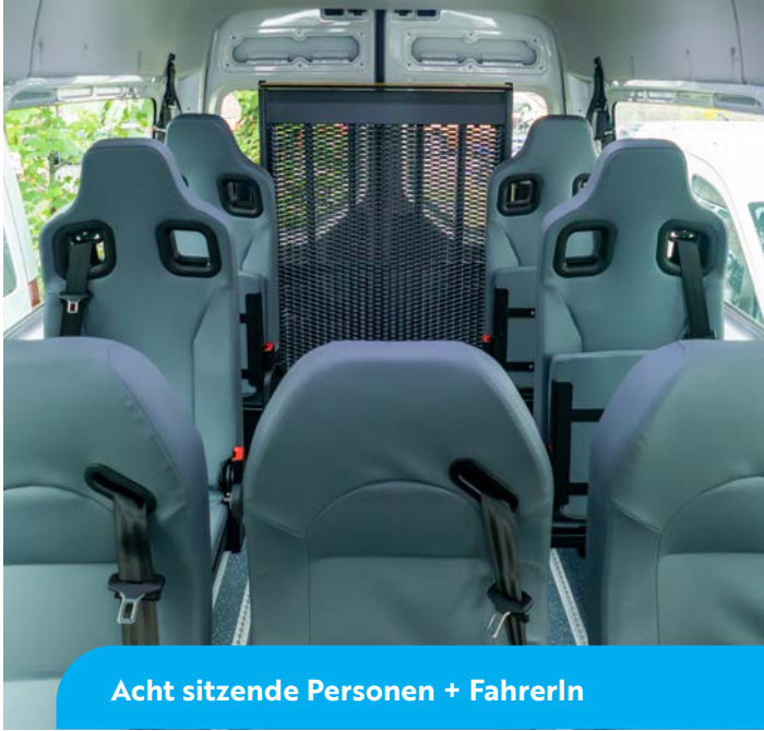
Acht sitzende Personen + FahrerIn